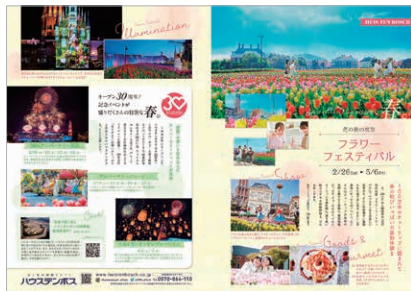
2P展開(例:ハウステンボス)