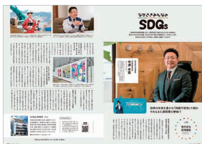
レギュラー広告(例:SDGs)