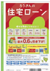
1P展開(例:表4/ろうきん)