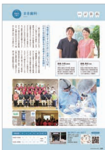
記事型1P(例:歯科特集)