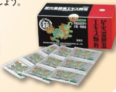
せいかうたんとう 星火温胆湯