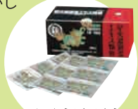
せいこううんたんとう 星火温胆湯