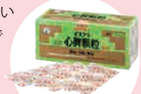
しんびかりゅう 心脾顆粒

貧血状態にあると日頃から肝の血流も少ない為に自律神経を安定させる力が弱く、憂うつや不安になりやすくなります。胃腸も弱いので疲れやすく、栄養を取り込んで体に必要なエネルギー、血液、筋肉に変えて保つ力も弱い状態です。胃腸から立ち直る力を付けましょう！緑の濃い野菜で元気な血液を！