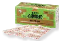
心脾顆粒 (しんぴかりゅう)