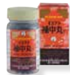
補中丸 (ほちゅうがん)