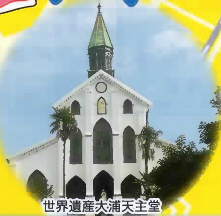
世界遺産大浦天主堂