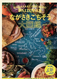
「ながさきごちそう大図鑑」