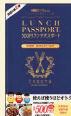
「ランチパスポート」