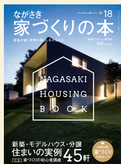
「ながさき家づくりの本」

ながさきプレスでは、各種別冊も発行しています。 グルメからハウジング、お出かけ情報まで、様々なニーズに対応しています。